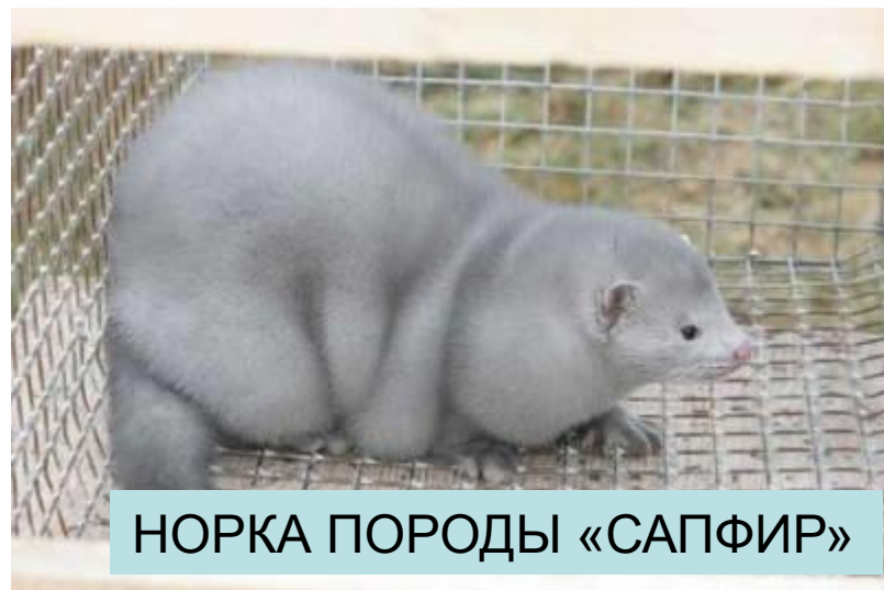
НОРКА ПОРОДЫ «САПФИР»