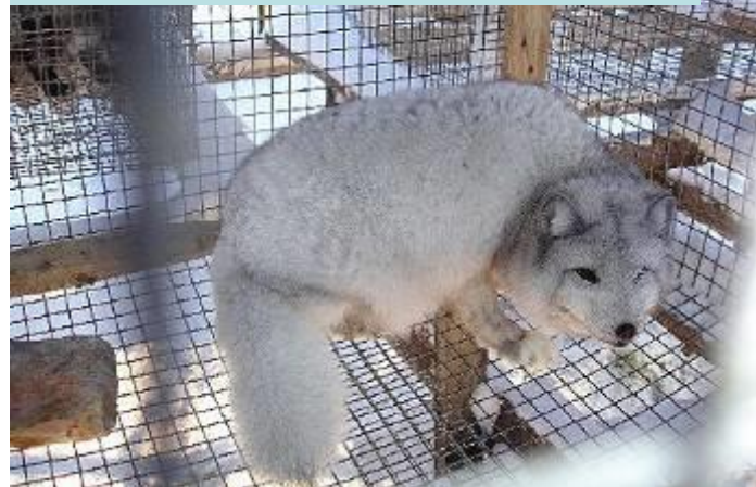
ПЕСЕЦ НА ЗВЕРОФЕРМЕ